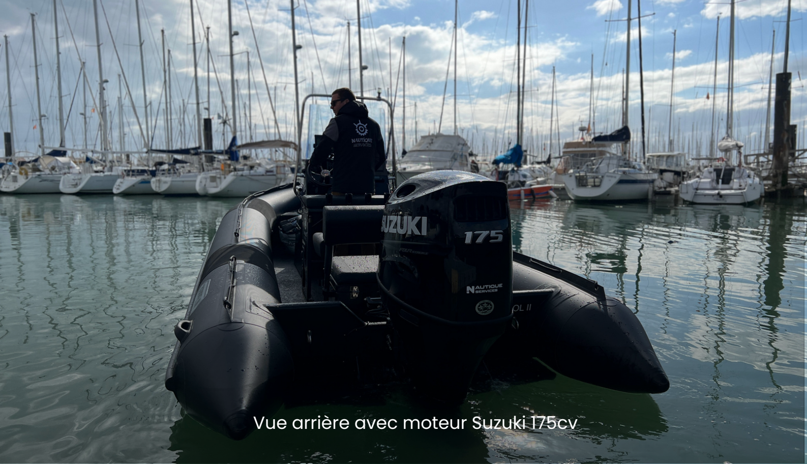
Vue arrière avec moteur Suzuki 175cv