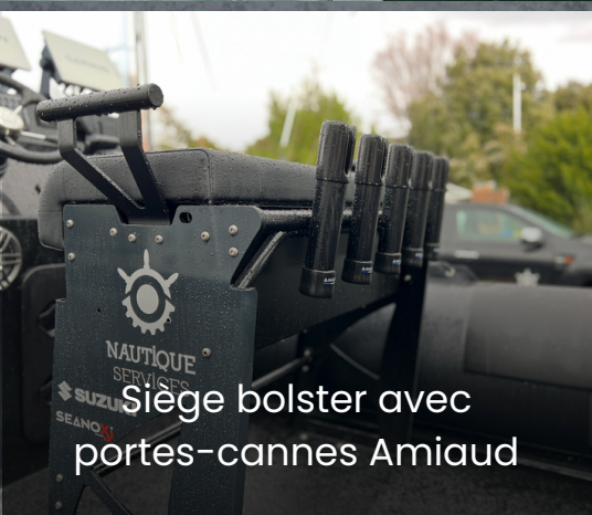
Siège bolster avec portes-cannes Amiaud