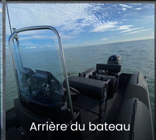
Arrière du bateau