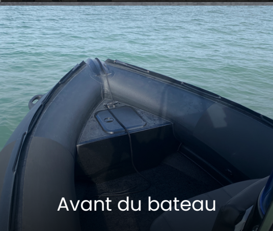
Avant du bateau