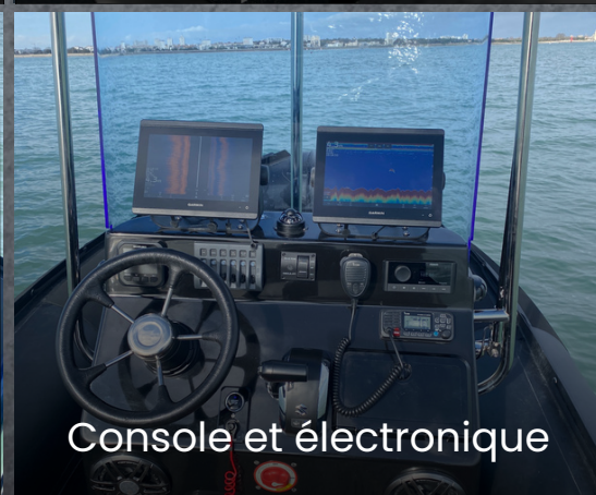
Console et électronique