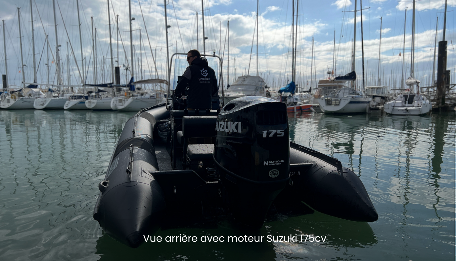
Vue arrière avec moteur Suzuki 175cv