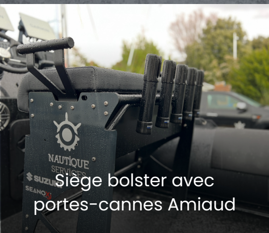
Siège bolster avec portes-cannes Amiaud