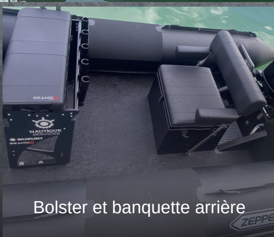
Bolster et banquette arrière